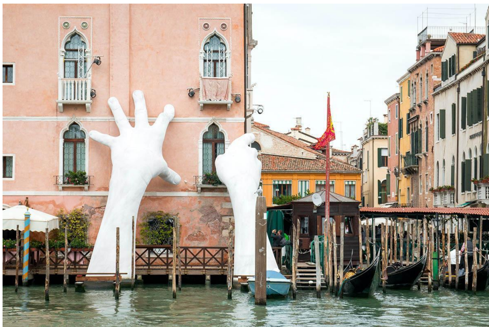
Support by Lorenzo Quinn in Venice, Italy